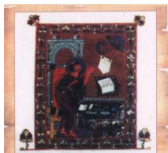
Евангелист Лука. Миниатюра из Остромирова Евангелия. 1056—1057 гг.

Книга полюбилась современникам и потомкам. Её переписывали и воспроизводили. Прожив более девяти столетий, Остромирово Евангелие и сегодня очень хорошо сохранилось. Это величайшая нацио-